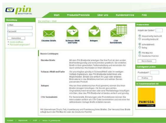
Pin Mail machte den Anfang: Zwölf weitere Postunternehmen wollen noch in diesem Jahr ihr Briefportal eröffnen.

PC/Client heruntergeladen werden, die kundenseitig technische oder sicherheitsrelevante Probleme verursachen